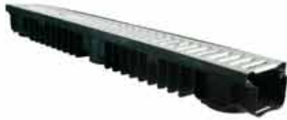
Odwodnienie z pokrywą ocynkowaną klasa A15