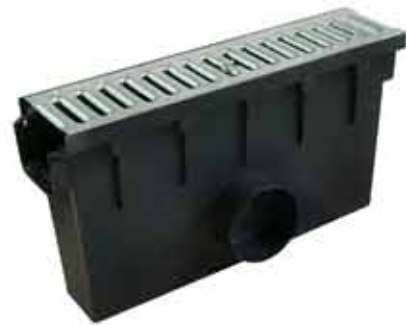
Studzienka z pokrywą ocynkowaną klasa A15