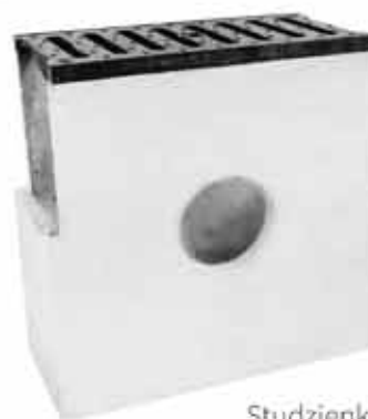
Studzienka betonowa z pokrywą żeliwną klasa D400