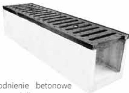
Odwodnienie betonowe z pokrywą żeliwną klasa D400