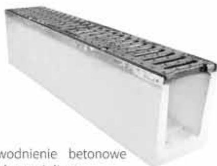
Odwodnienie betonowe z pokrywą żeliwną klasa C250