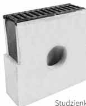
Studzienka betonowa z pokrywą żeliwną klasa C250